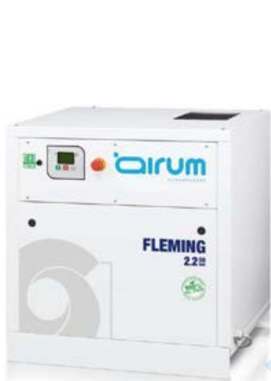
Compresor scroll base