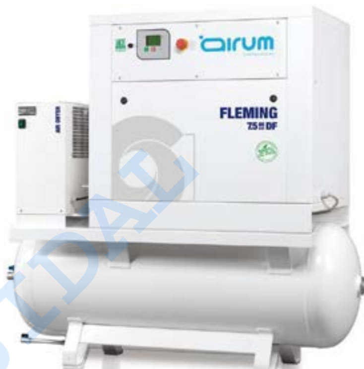
Compresor scroll base sobre caldera con secador